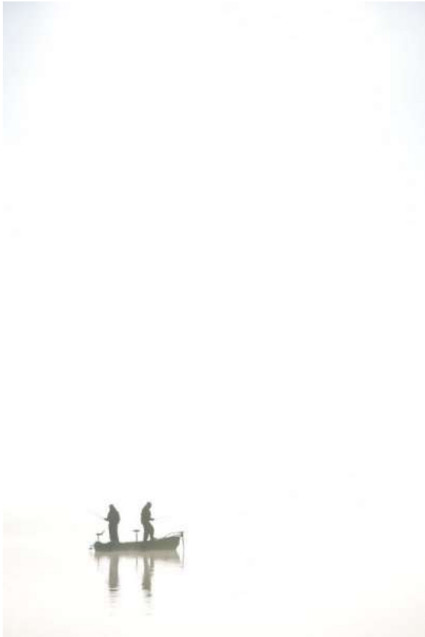
La brume magique du Matin à Saint Michel !